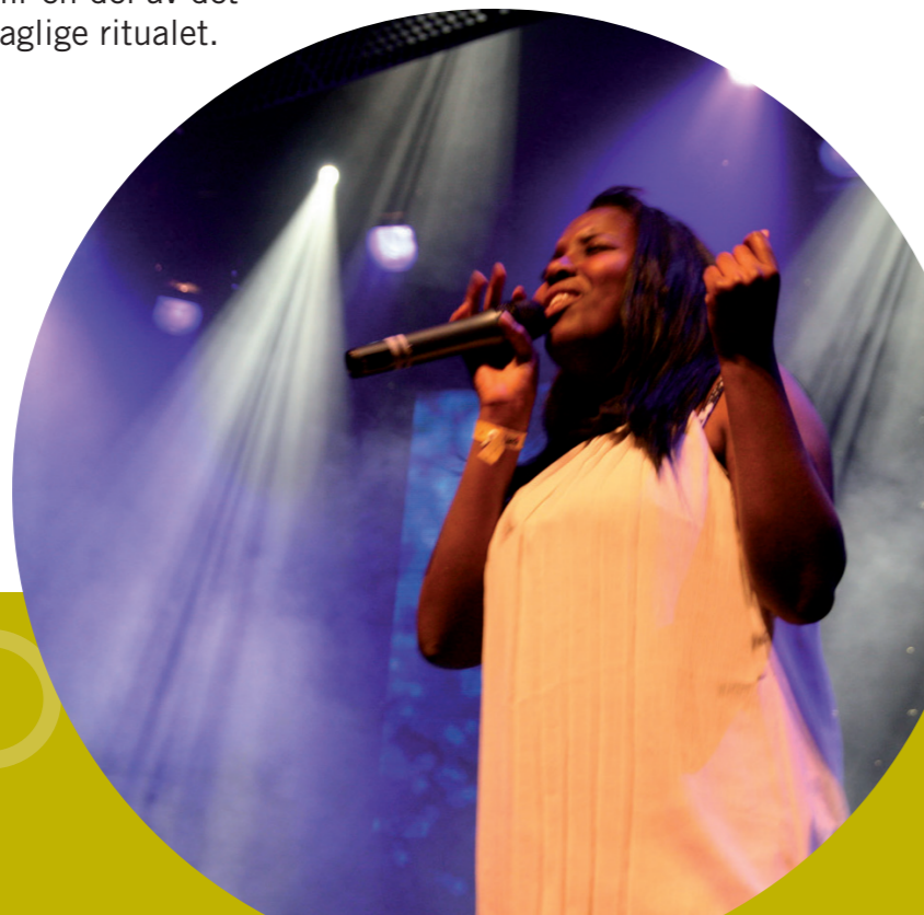
Grafisk design: Krohn Form tlf. 926 99 404

Er du danser får du på festivalene instruksjon og trening om basistrening som er viktige for dansere i alle sjangre. Hovedfokus blir på øvelser for styrke, spenst, koordinasjon og balanse. Deltagerne lærer også hvordan de best kan arbeide med forskjellige øvelser på dette slik at det blir en del av det daglige ritualet.